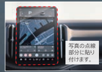
センターディスプレイ プロテクションフィルム 写真の点線 部分に貼り 付けます。