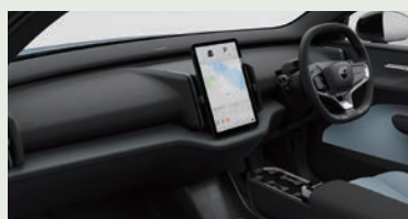
プラスチック廃棄物から作られた デコラティブ・パネル