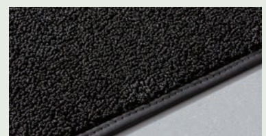
漁網などの廃材をリサイクルした テキスタイル・フロアマット