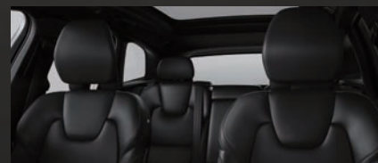
ブラックで統一。スタイリッシュで洗練された雰囲気を出すインテリア。