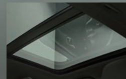
チルトアップ機構付 電動パノラマ・ガラス・サンルーフ