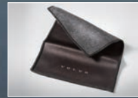
マイクロファイバークロス