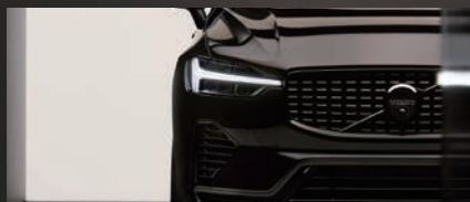
フロントグリルを全面的にブラックアウトし、クールな表情に。