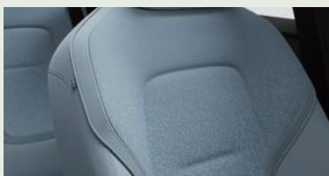
ピクセルニットの採用による裁断時の 廃棄物の出ない生地製造

EX30は、ボルボのサステナビリティに対する長年の取り組みの最新かつ最も進化した形です。この車には、リサイクル素材や環境に配慮した技術がふんだんに盛り込まれており、エネルギー効率やカーボンフットプリントの削減にも大きく貢献しています。