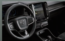
テイラード・シルクメタル・ スポーツステアリングホイール/ カッティングエッジ・アルミニウム・パネル