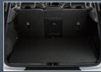
リバーシブルラゲジマット