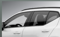
グロッキーブラック・トリム (サイドウィンドー・トリム/ インテグレートッド・ルーフレール)