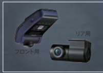
ボルボ・ドライブレコーダー・360 フロント用 リア用