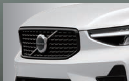
グロッキーブラック・ フロントグリル (格子状グリル)