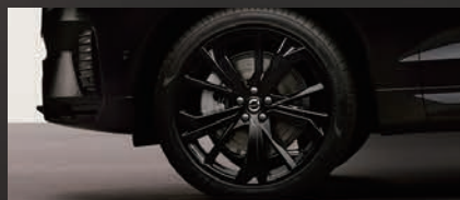
グロッキーブラックの専用21インチアルミホイール。