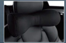
ネッククッション